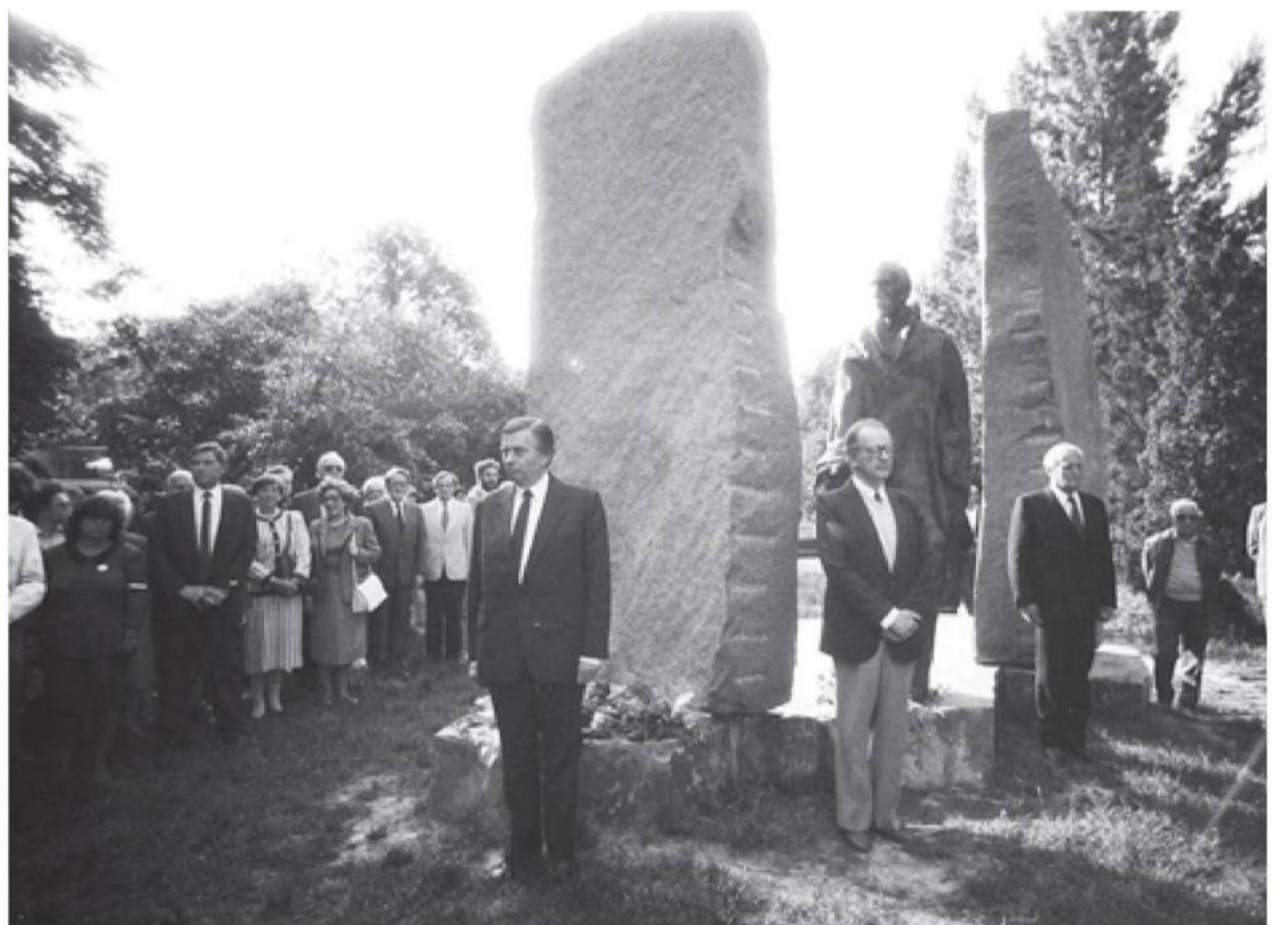
Antall József, Szabad György és Göncz Árpád a Wallenberg-szobornál

A szovjet vezetésnek és a quisling Kádárnak is egyre terhesebbé vált, hogy az ENSZ közgyűlése évente, nagy többséggel elítélte őket a magyar forradalom kegyetlen eltiprásáért. A levéltelen előfeltétele volt, hogy, az ítélet nagyságát tekintve teljes mértékű amnesztiát hirdessenek. A színpalak mögött tárgyalások indultak, amelyek részleteit a később Amerikába disszidált tárgyalásvezető népköztársasági követ megírta. Sajnos a nyugatiak belemertek egy sor kizáró klauzulába, mint a gyilkosság, hűtlenség, visszaesés stb. Nem tudták, hogy a harcokban való