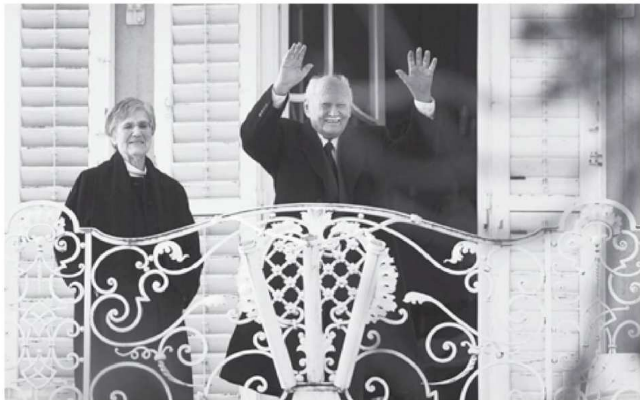
Felcséggel, Zsuzsával

(Jelen soraim a „Hosszútávutók” című írásom felhasználásával készültek, amely megjelent László György-Wisinger Isván: Visszanézve c. kötetében. Megjelent 2007-ben a Glória Kiadó gondozásában.)